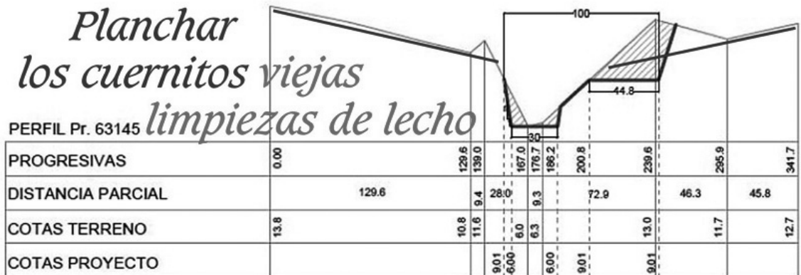
a) Sección en curva horaria